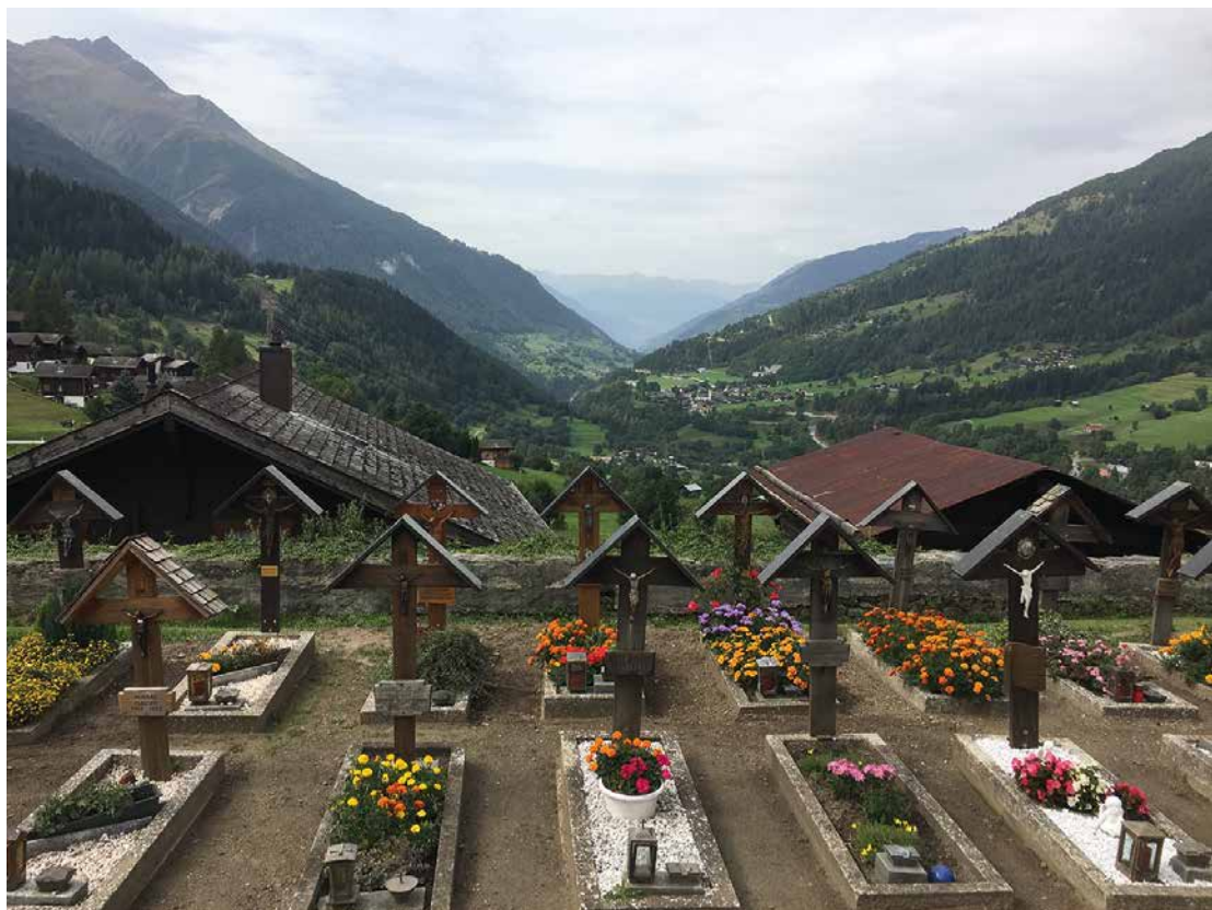
Friedhof Ernen VS

Seelsorgeeinheit Düdingen – Bösinggen/Laupen